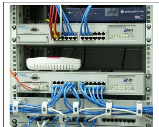
Teil eines Netzwerkracks (im Bild 2 Hochleistungs-Switche mit Gigabit-Glasfaser-Serveranbindung, DSL Internet-Anbindung über Bintec Router)