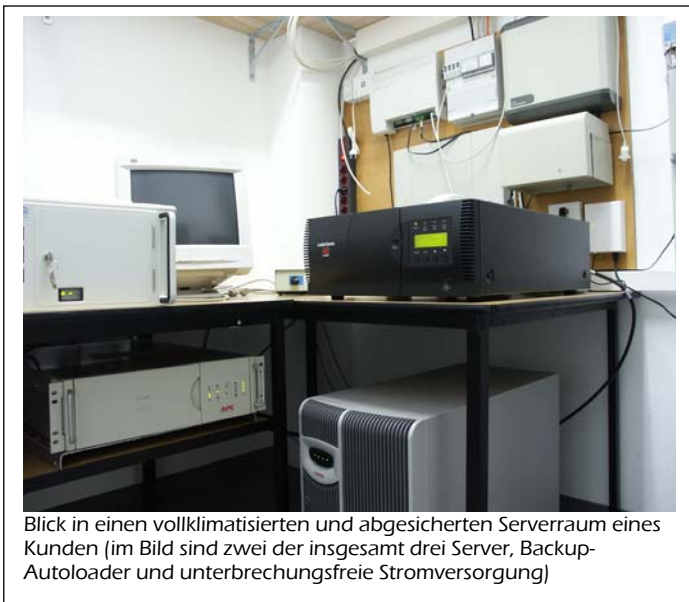
Blick in einen vollklimatisierten und abgesicherten Serverraum eines Kunden (im Bild sind zwei der insgesamt drei Server, Backup-Autoloader und unterbrechungsfreie Stromversorgung)

Unser Team ist seit 1995 erfolgreich in der EDV-Branche tätig. Seit 1997 spezialisiert auf das Segment der gewerblichen Anwender. Dort spielen wir unser Know-how bei Netzwerkimplementierungen, Intra- und Extranets, sowie der Internetanbindung aus. Von der Planung, über die Realisierung bis zur Wartung bieten wir unseren Kunden alles aus einer Hand. Dabei schrecken wir auch nicht vor scheinbar komplizierten Aufgabenstellungen und Anforderungen zurück.