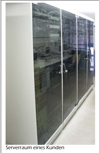
Serverraum eines Kunden

Als junges, dynamisches und innovatives Unternehmen der EDV-, Telekommunikations- und Netzwerktechnik sowie der gesamten Bandbreite der Internetdienstleistungen bieten wir zukunftsorientierte und maßgeschneiderte Lösungen für gewerbliche Anwender.