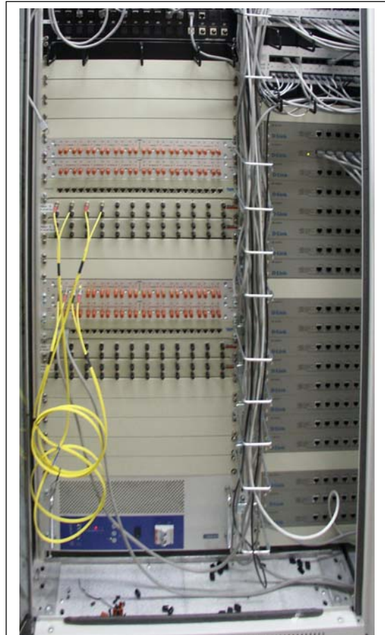
Blick in einen Netzwerkschrank eines Kunden mit optischer Netzwerkverkablung (links) und mehreren Switches (rechts)

Damit das nicht nur ein Ziel bleibt, sondern für Sie Realität ist bzw. wird, stehen wir Ihnen rund um die Uhr zur Verfügung, sogar am Wochenende oder an Feiertagen. Gerne realisieren wir Ihre Projekte auch am Wochenende um den normalen Betriebsablauf so wenig wie nur irgendmöglich zu stören. In Notfällen stehen wir Ihnen und unseren Geschäftskunden 24h - 7 Tage die Woche zur Verfügung - auch wenn Sie noch nicht Kunde bei uns sind.